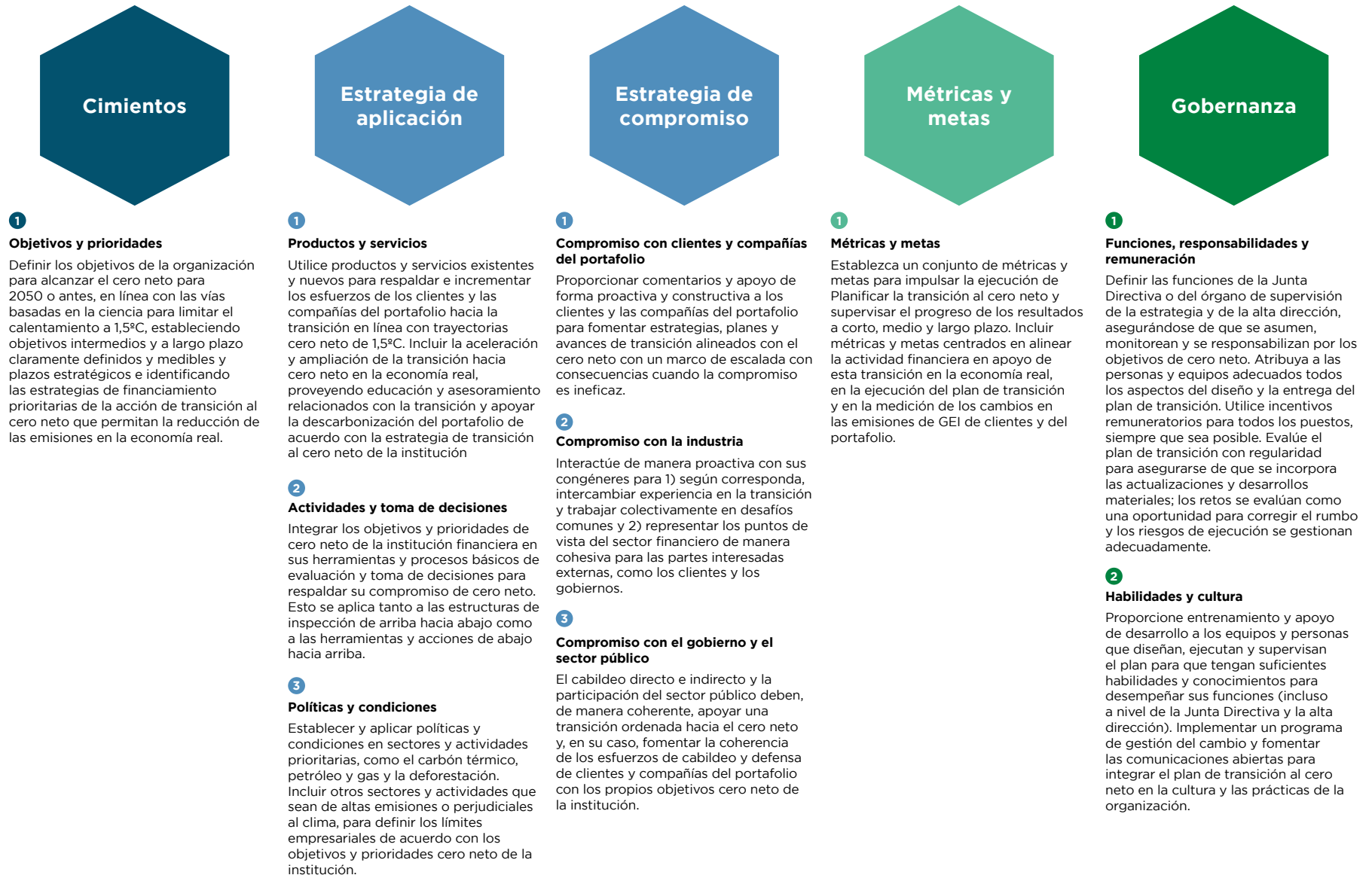
Figura E-4. Temas, componentes y recomendaciones para un plan de transición al cero neto para las instituciones financieras