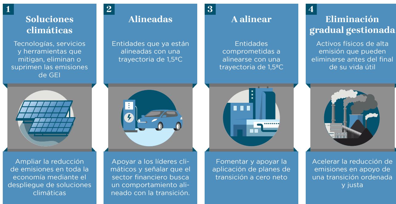
Figura E-2. Cuatro estrategias clave de financiamiento con cero emisiones netas

economía real que promueven la transición al cero neto.